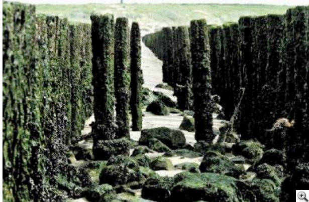
De palen van Walcheren, belaagd door wormen en de elementen, lijken van alle tijden.